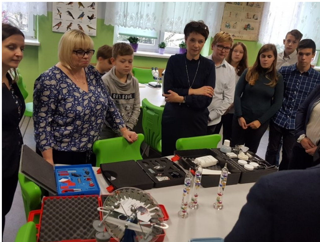
Termometry Galileusza i maszyna elektrostatyczna w użyciu.