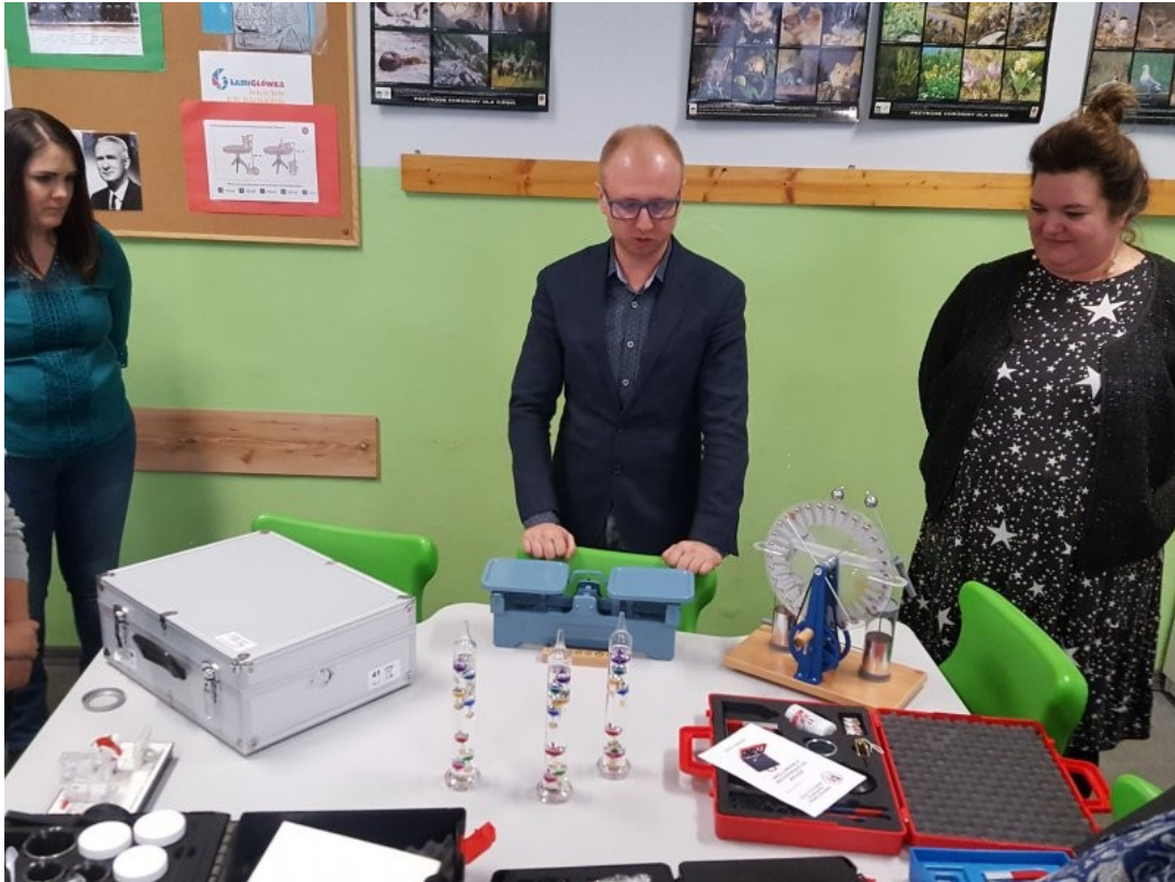
Krótki wykład o tym, jak działa elektrownia wiatrowa.