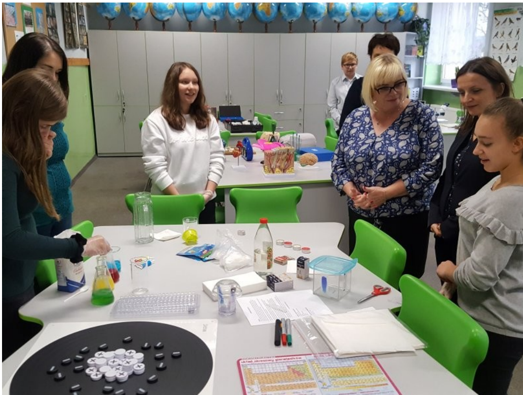
Uczennice z klasy VIII b przeprowadzają doświadczenia chemiczne.